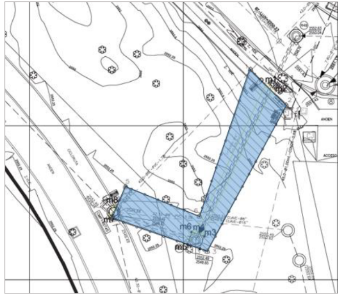
Figura 1: Obras objeto del POC

Así mismo se identifica el siguiente esquema correspondiente a las áreas objeto del POC.